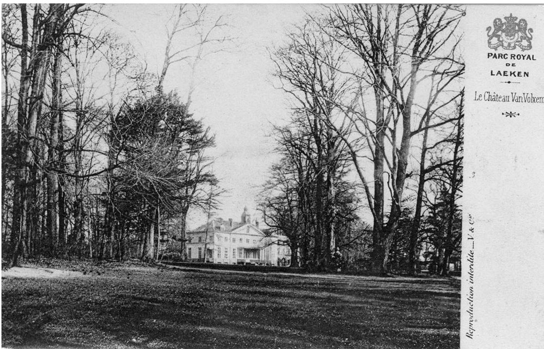
Campagne Van Volxem

Meer erover in de bijdrage van Wim van der Elst: De Nederleest in 1890 , in LACA Tijdingen jaargang 16 nummer 3 – maart 2005.