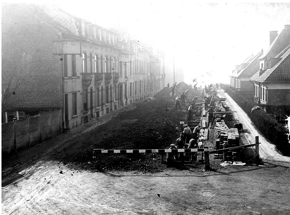
Werken Paul Jansonstraat

Toeval of niet, er werd in Laken op de Mutsaard een straat naar Paul Janson genoemd. Die heette daarvoor Leopold II-straat, en was niet meer dan een onbeduidend weggetje dat wel sinds de grenswijziging van 1897 de scheiding tussen Heembeek en Laken vormde (daarvoor reikte Heembeek een eind verder, tot het midden van de Wandstraat). Men is geneigd aan te nemen dat die