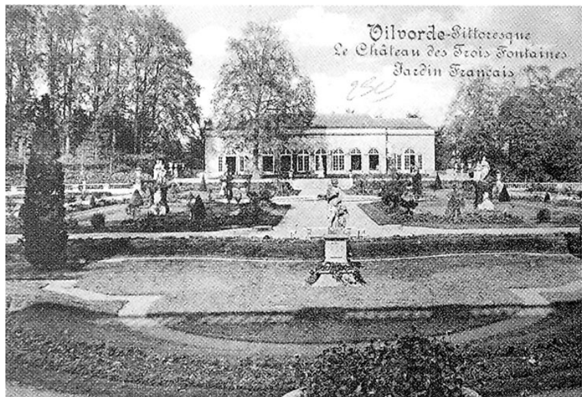
Orangerie Drie Fonteinen